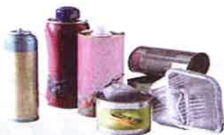
Emballages métalliques : boîtes de conserve, bidons de sirop...