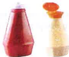
Flacons de produits alimentaires