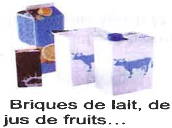
Briques de lait, de jus de fruits...