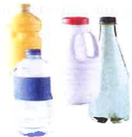
Bouteilles en plastique