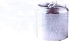
Canettes de soda...