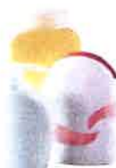
Flacons de gel douche, shampoing...