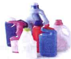
Flacons de produits d'entretien